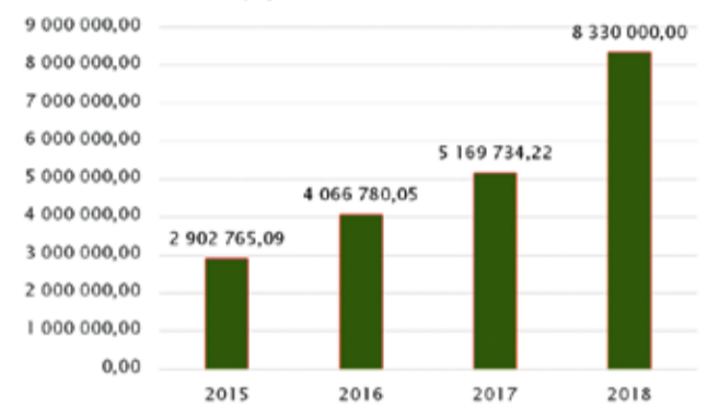
Inwestycje w latach 2015-2018

noszącego się do budżetu gminy, sukcesu ekonomicznego odnoszącego się do stanu gospodarki lokalnej, sukcesu infrastrukturalnego oraz sukcesu społecznego . W rankingu gmin wiejskich awansowaliśmy w odniesieniu do poprzedniej kadencji o prawie 1000 pozycji z 1217 na 227 miejsce w rankingu, a najbliż-