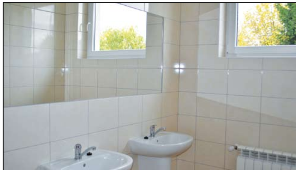
Wykończone sanitariaty w sali wiejskiej w Kopanicy

Podkreślić należy duże zaangażowanie mieszkańców, którzy w tzw. czynnie społecznym wykonali szereg prac przy realizacji projektów, zarówno w Kopanicy, jak i Kiełpinach. Deklarowany udział mieszkańców miał wpływ na punktację wniosków podczas oceny wniosków, a ponad to stał się elementem większej integracji i wzmocnienia poczucia przynależności do wspólnoty sołeckiej.