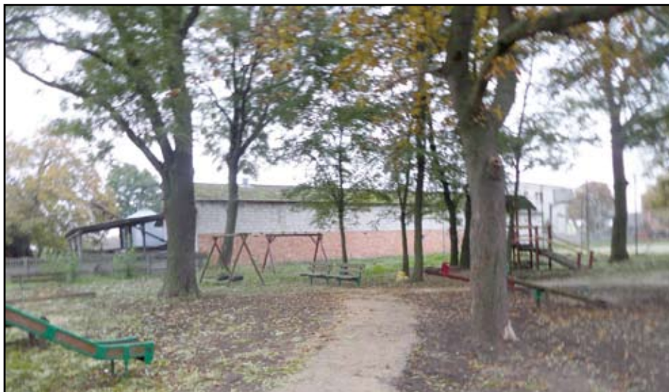
Alejką spacerową w Kiełpinach