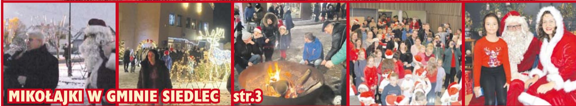
MIKOŁAJKI W GMINIE SIEDLEC str.3